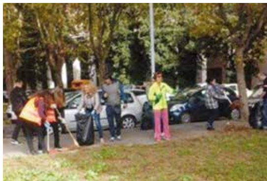
I cittadini all'opera