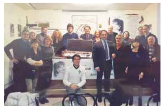
La nostra squadra di volontari