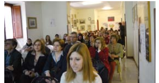
Il pubblico intervenuto al convegno "La Donna Oggi".