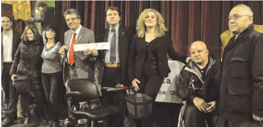
Consegna carrozzina elettrica.