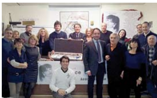
Foto di gruppo consegna Fibroscopio, Consiglio Direttivo, Volontari e Benefattori.