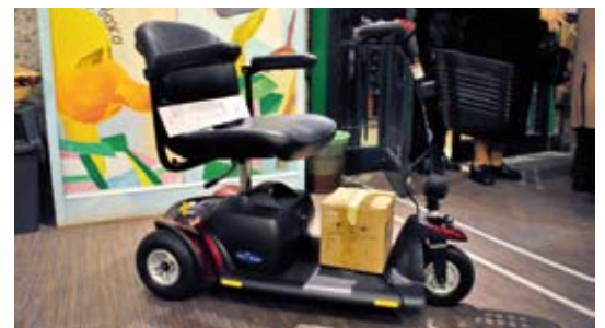
Carrozzina elettrica donata dall'Associazione La Voce di Rita

Anche quest'anno, quando compila la Sua denuncia dei redditi, ha l'opportunità di devolvere il 5 x 1000 dell'IRPEF all'Associazione LA VOCE DI RITA Onlus: basta una firma e l'indicazione del Codice Fiscale della nostra Associazione, 97405480589 . La Vostra donazione non costa nulla e detraibile dalle imposte. GRAZIE