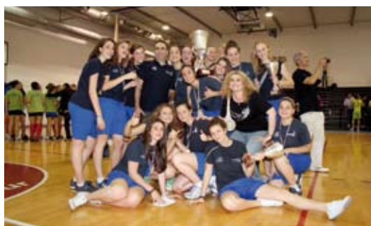
Squadra femminile vincitrice alle Finali Regionali Under 16 Fonte Volley