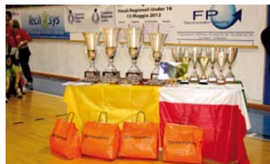
Coppe offerte dall'Associazione LA VOCE DI RITA