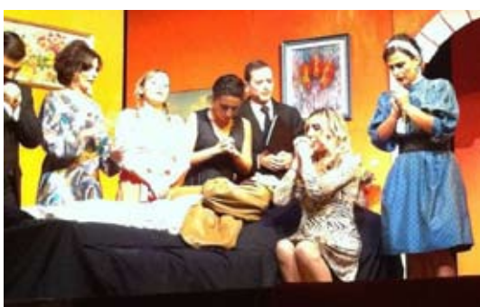
Spettacolo Teatrale "Perché Capitano tutte a Me" Compagnia Isigol (foto di scena).